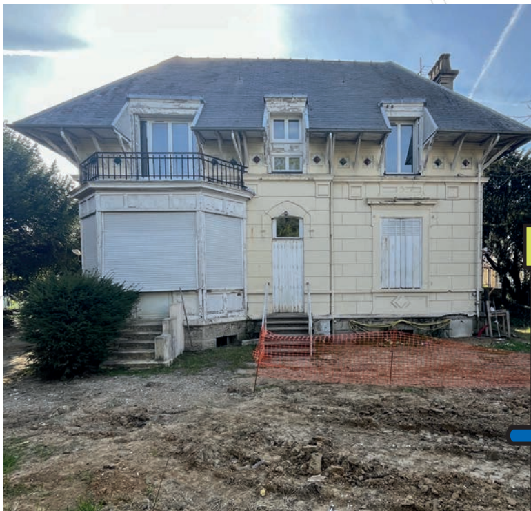
La Ville a racheté le Pavillon Joffre, avec pour projet d'en faire un lieu dédié principalement à la mémoire de la ville.